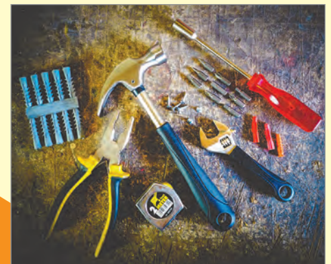
Se trata de mantener todas sus herramientas listas. Las pláticas informativas agudizan y afinan las herramientas de seguridad de todos

rápidos recordatorios de cómo trabajar de manera segura y protegernos mutuamente en las instalaciones de nuestros clientes. Sea audaz. Hable cuando vea algo que no es seguro, es responsabilidad de todos.