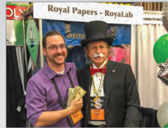
¡Intenta no gastarte todo en un solo lugar!

(Fondo Amigo) esta primavera. El equipo tuvo que aprender más acerca de y cómo involucrarse en una gran organización. El Buddy Fund enriquece las vidas de los jóvenes en riesgo al ofrecer oportunidades deportivas y equipos a través de las organizaciones de servicio locales. Todos estamos emocionados de devolver algo de amor a la comunidad de St. Louis.