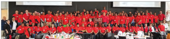
¡No podríamos estar más contentos de tener todas estas caras maravillosas en nuestra familia 4M!

Nuestro equipo en Georgia ha tenido su trabajo hecho para ellos en un gran comienzo de trabajo. El trabajo en equipo 360 o contribuyó a un comienzo extremadamente exitoso con algunos números récord de nuevos Miembros del equipo y la cantidad de metros cuadrados que se están limpiando. Gracias a todos los involucrados en hacer la transición para nuestro cliente sin problemas, sin dolores, y seamos honestos ... ¡un poco divertida! ¡Te lo debemos todo a ti!