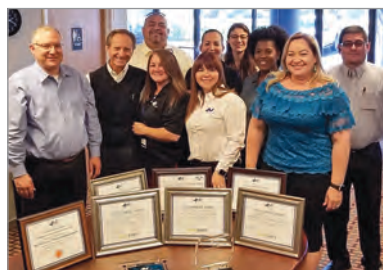
¡Region 60 limpia!