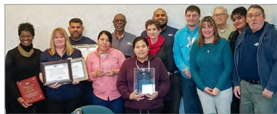
¡Bien hecho, Región 40!