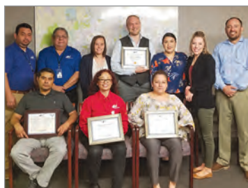
¡El equipo de San Antonio fue todo sonrisas!