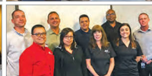
El trabajo en equipo 360 o es sólo una de las cosas que hacen que 4M sea excelente. ¡Nuestros Miembros de Equipo realmente son los mejores!