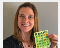
¡La paga segura en 4M!