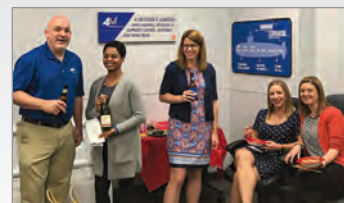
¡Amigos, bebidas, comida y servicio a nuestra comunidad!

(Fondo Amigo) esta primavera. El equipo tuvo que aprender más acerca de y cómo involucrarse en una gran organización. El Buddy Fund enriquece las vidas de los jóvenes en riesgo al ofrecer oportunidades deportivas y equipos a través de las organizaciones de servicio locales. Todos estamos emocionados de devolver algo de amor a la comunidad de St. Louis.