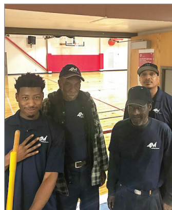
También podemos divertirnos con el cuidado de los pisos!