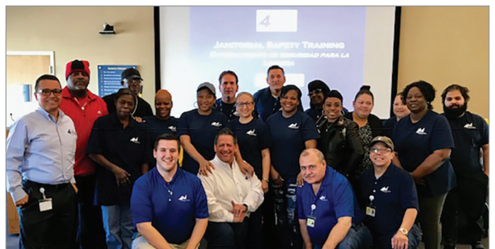
Muchas sonrisas en el arranque del trabajo en Nemours.