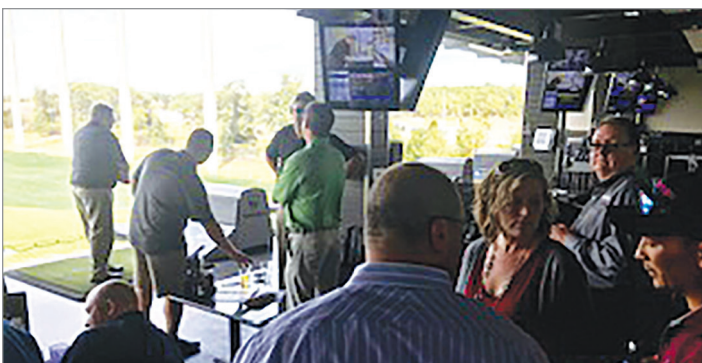
Nunca es un mal día en TopGolf.