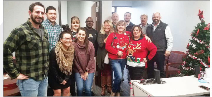
Toda la familia está aquí.