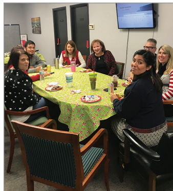
¡Comidas y dulces navideños para todos!