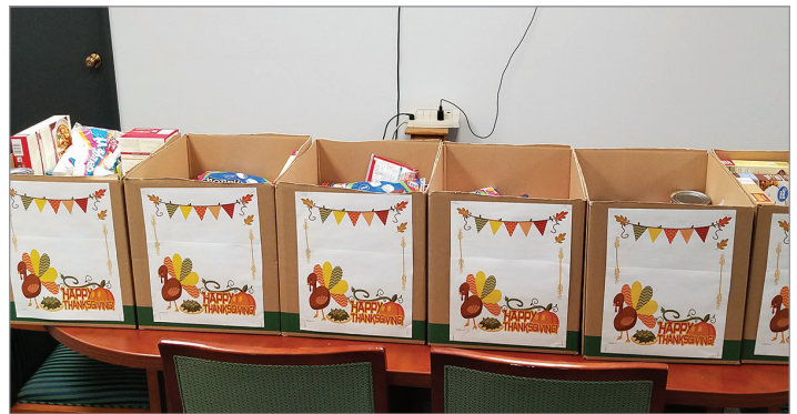
Cajas llenas significan estómagos llenos para algunas familias en necesidad.