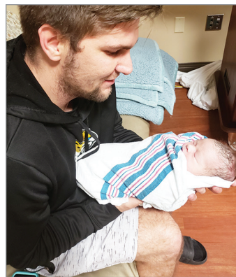
¡Ahmo con su nuevo mejor amigo!

La oficina de Tampa tuvo una visita especial en diciembre. El único e inigualable SANTA se detuvo para asegurarse de que todos estuvieran en la Lista de Buenos Chicos. ¡Por supuesto que lo fueron!