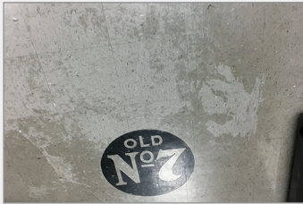
El numero 7 nunca lució mejor.

Al estilo de la familia 4M, todo el equipo de Nashville se reunió para celebrar juntos el espíritu navideño. Manténgase firmes, equipo, ¡su familia está creciendo rápidamente!