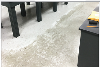
¡Impresionante, qué diferencia!