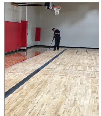
Había mucho terreno por cubrir, pero lo logramos.