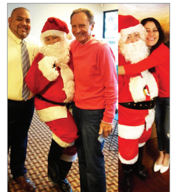
¡Jo, jo, jo, jo!