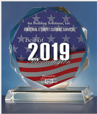
Felicitaciones al equipo de Bloomington