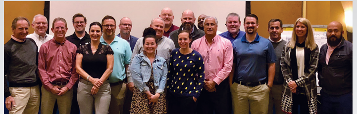
¡Es maravilloso cuando todo el equipo se reúne para trabajar Y jugar!

Se invitó a la dirección de 4M a la sede principal del vendedor Kärcher en Stuttgart, Alemania, para participar en su evento de lanzamiento de baterías. Este evento anunció una nueva tecnología de baterías para líneas de productos nuevos y existentes. ¡4M probó estos nuevos productos y recorrió la fábrica de Kärcher!