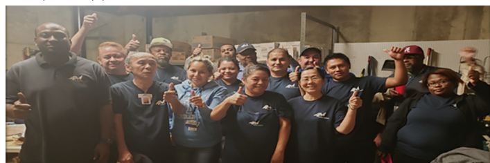
¡Gracias equipo Westport!