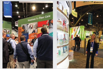
Había mucho que ver en la feria de la ISSA, además de divertidas demostraciones del vendedor Diversey de 4M.