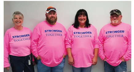
¡Se ven geniales de rosa!

El personal de día de 4M en Logan Aluminium apoyó el programa Rosa para la concientización sobre el cáncer de mama. Estos eventos de rosa reúnen a las personas para crear conciencia y recolectar dinero para donar a cualquiera de las cientos de organizaciones benéficas contra el cáncer de mama en todo el mundo. El equipo de Logan Aluminium se unió y mostró su orgullo rosado por el mes de la concientización sobre el cáncer de mama.