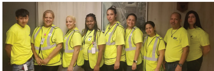
¡Gracias por todo, equipo!