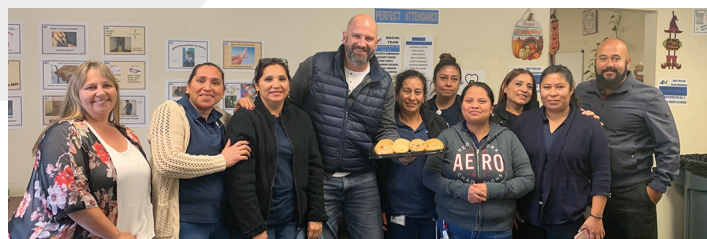
¡Algunos miembros del equipo de Indianápolis celebrando con dulces!