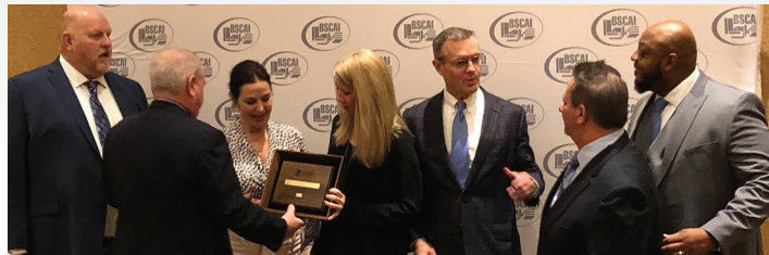
El equipo se reunió para aceptar varios premios de la industria de BSCAI.